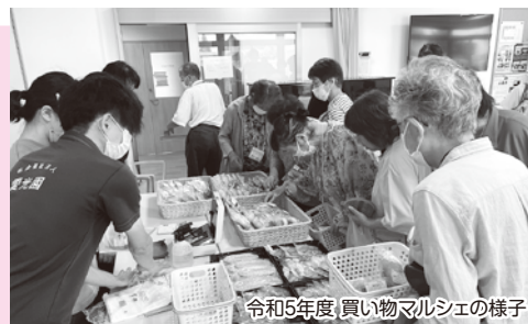
令和5年度「買い物マルシェの様子