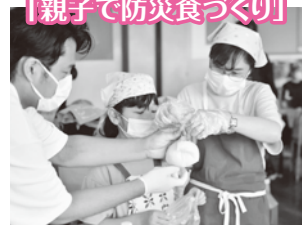
「親子で防災食づくり」

災害をテーマに親子で防災食づくりを行いました。新聞紙でお皿をつくり、ポリ袋を活用した調理法でカレーとスモアをつくりました。備えの大切さと災害が起きたときに親子で助けあう心を育む時間となりました。