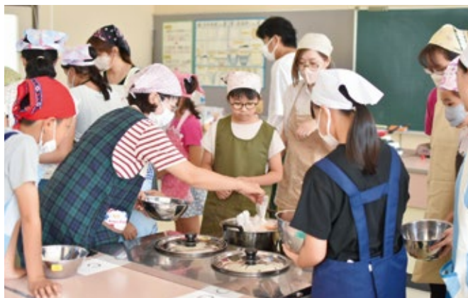
▲小学生親子ボランティアスクール「防災食作り体験」を行いました。

昨年度は、皆様から12,856,565円の募金をお寄せいただきました。このうち、6,134,565円が地域配分として、今年度の地域福祉事業に役立てられています。今年も、募金運動へのご理解と温かいご協力をよろしくお願いいたします。 ※募金は任意であり強制するものではありません。